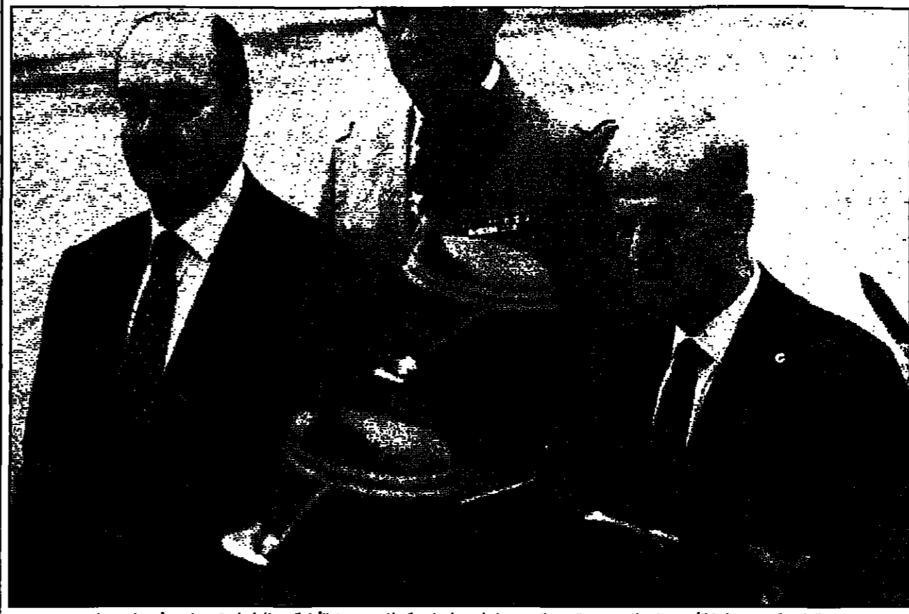
الرئيس السوري حافظ الأسد وتلقيه الفرنسي جاك شيراك بحضرة استعراض عسكري لدى وصول الأول إلى مطار أورلي قرب باريس أمس (دويتشه)

الأسد في إحدى مقابلاته الصحافية، أما في زيارة رسمية إلى فرنسا من أجل التفاوض على وقف إطلاق النار بين الجانبين المتحاربين في لبنان، وهو ما أكدته تصريحاته السابقة. وتعد زيارة الأسد إلى باريس من أجل التفاوض على وقف إطلاق النار بين الجانبين المتحاربين في لبنان، وهو ما أكدته تصريحاته السابقة. وتعد زيارة الأسد إلى باريس من أجل التفاوض على وقف إطلاق النار بين الجانبين المتحاربين في لبنان، وهو ما أكدته تصريحاته السابقة. وتعد زيارة الأسد إلى باريس من أجل التفاوض على وقف إطلاق النار بين الجانبين المتحاربين في لبنان، وهو ما أكدته تصريحاته السابقة.